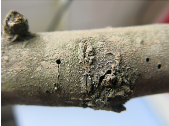
otvori na granama

Pregledom višnje ,ustanovljeno je prisustvo otvora na granama, što ukazuje na prisustvo malog potkornjaka Scolytis rugulosus .Potkornjaci su indikatori zdravstvenog stanja u voćnjacima.U ovom periodu ne preporučuje se primena insekticida, već je potrebno obaviti rezidbu i odseći grane sa otvorima, nakon toga odsečene delove izneti sa parcele i spaliti.